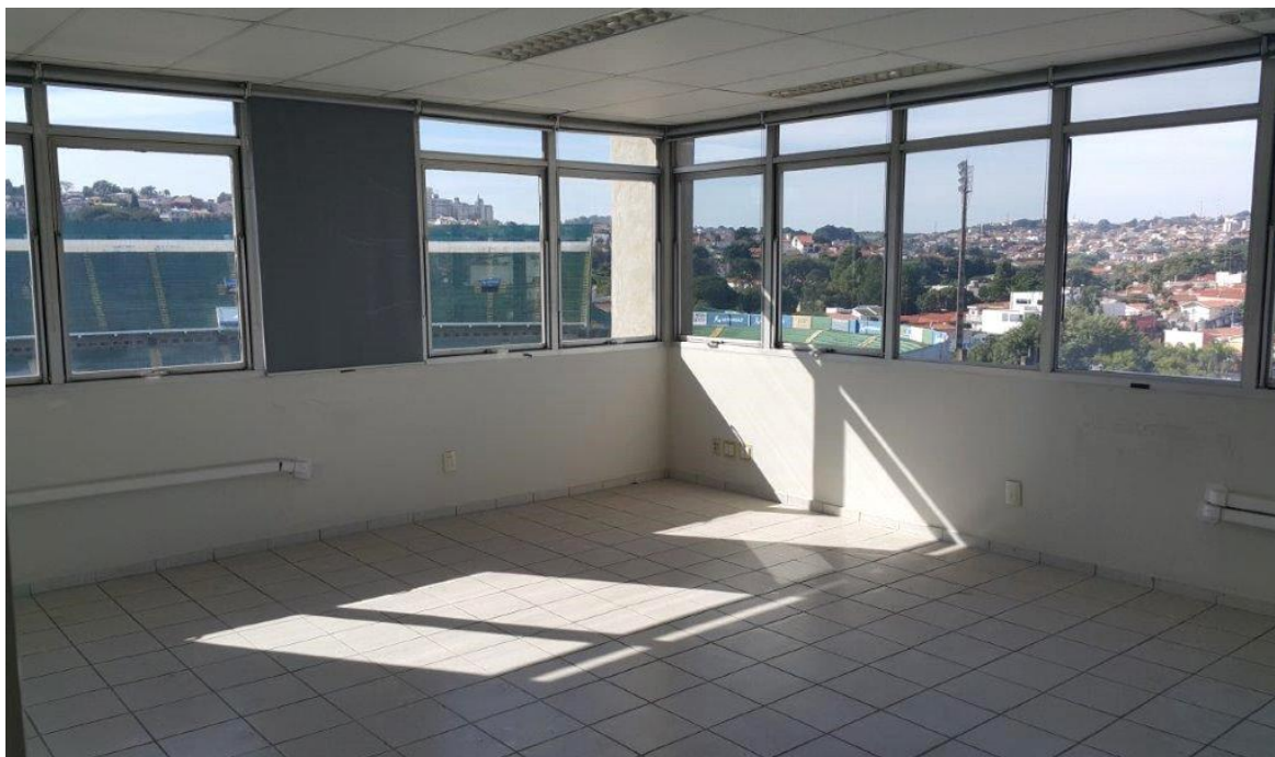
Figura 2 - Imagem interna dos imóveis