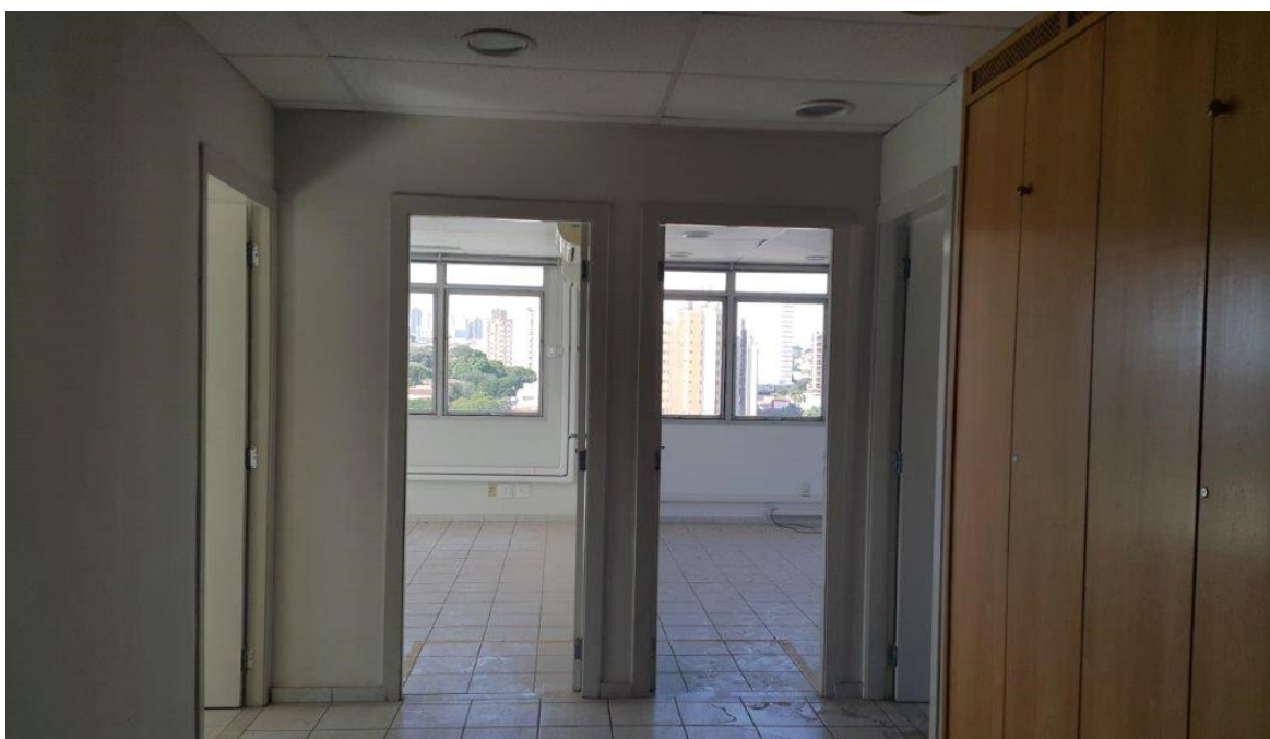
Figura 3 - Imagem interna dos imóveis