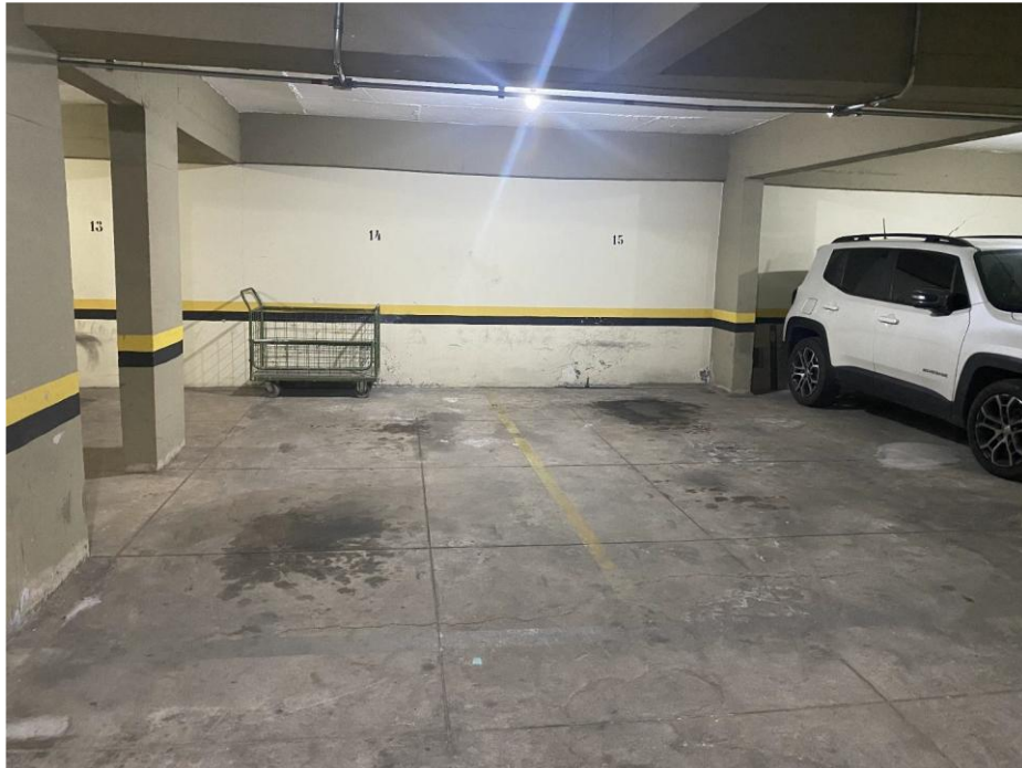
Figura 4 - Imagem das vagas de garagem