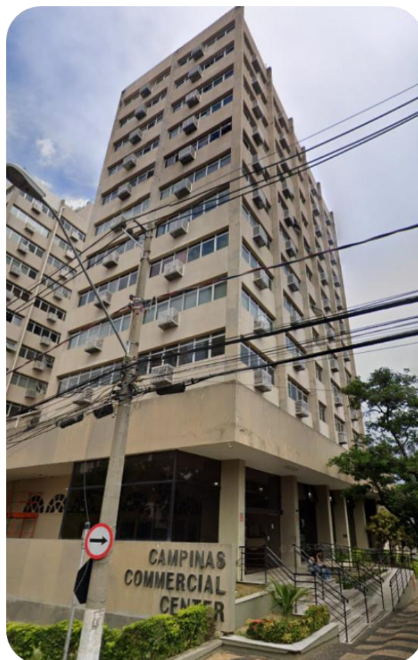
Figura 1 - Fachada do edifício