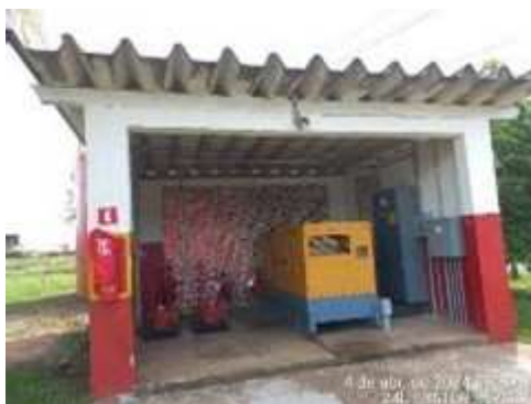
Imagem 2: Casa de bombas