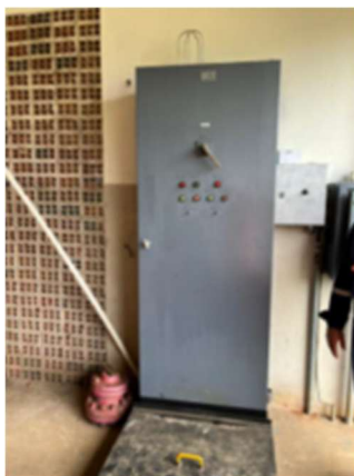
Imagem 14: Painel elétrico do sistema de combate a incêndio

2.1.4. PAINEL ELÉTRICO DO SISTEMA DE COMBATE À INCÊNDIO : painel elétrico de 440 v.