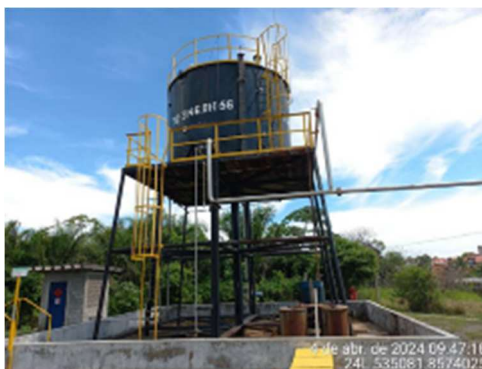
Imagem 1: Plataforma de sustentação do tanque