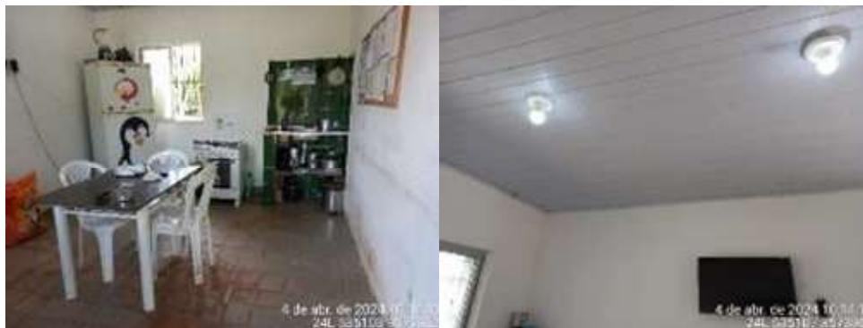
Imagens 3 e 4: Copa e Teto com forro em PVC

1.3.3. VESTIÁRIO: construção com 7,23m 2 , com um pavimento com estrutura em concreto, fechamentos em alvenaria revestida interna e externamente, com azulejos na parede internamente e pintura externamente. Esquadrias de alumínio e vidro liso. Forro em PVC. Pisos em cerâmica.