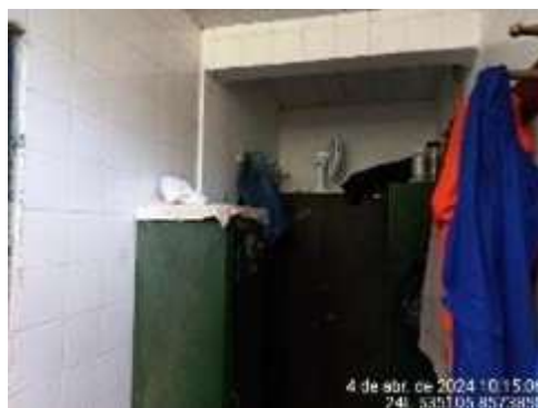
Imagem 5: Vestiário

1.3.3. VESTIÁRIO: construção com 7,23m 2 , com um pavimento com estrutura em concreto, fechamentos em alvenaria revestida interna e externamente, com azulejos na parede internamente e pintura externamente. Esquadrias de alumínio e vidro liso. Forro em PVC. Pisos em cerâmica.