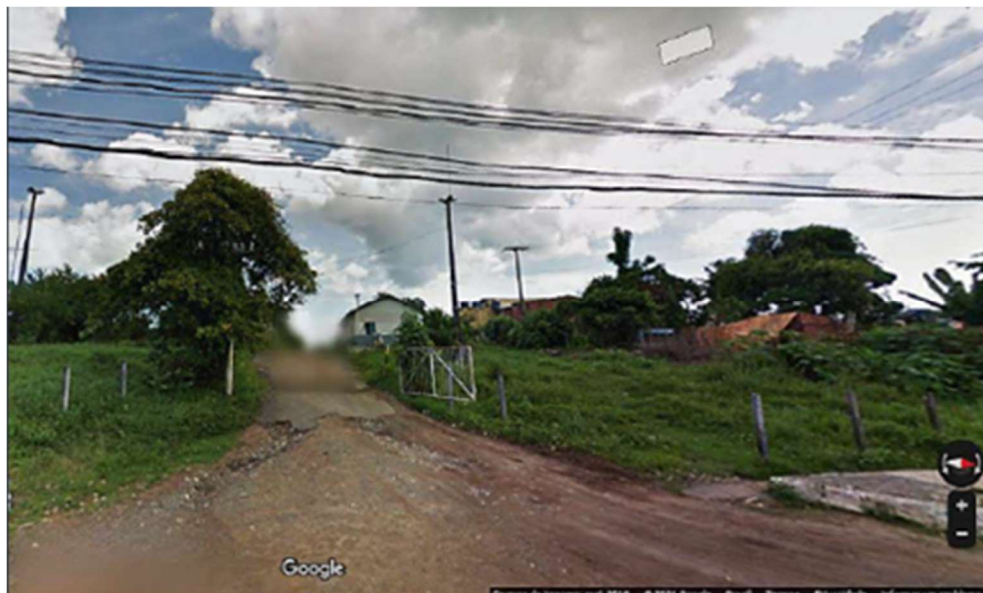
Imagem 16: acesso ao imóvel pela rua São Judas Tadeu.