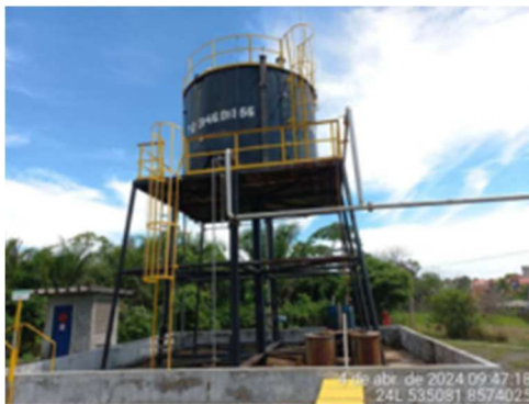
Imagem 12: Tanque de armazenamento TQ-3146-01-I-56

2.1.3. BOMBA CENTRÍFUGA DO SISTEMA DE COMBATE À INCÊNDIO : moto-bomba elétrica com potência de 150 cv.