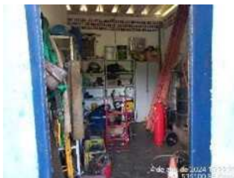
Imagem 10: Almojarifado

1.3.6. ALMOXARIFADO : construção com um pavimento com estrutura em concreto, fechamentos em alvenaria revestida interna e externamente, com pintura sobre reboco. Teto com telhado de fibrocimento. Porta de madeira. Pisos cimentado liso.