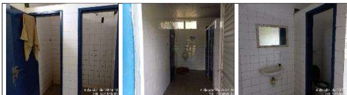
Imagens 6 a 8: Banheiro

1.3.4. BANHEIRO: construção com 10,82m 2 , com um pavimento com estrutura em concreto, fechamentos em alvenaria revestida interna e externamente, com azulejos na parede internamente e pintura externamente. Esquadrias de alumínio e vidro liso. Forro em PVC. Pisos em cerâmica.