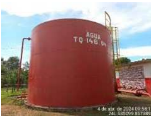
Imagem 11: Tanque de Armazenamento de água (TQ-3146-01-04)

2.1.1. TANQUE DE ARMAZENAMENTO (TQ-3146-01-04) : tanque atmosférico vertical com capacidade de 160m 3 , com 8,86m de altura e 2,80m de largura. Construído em aço carbono, sem proteção catódica, com teto fixo e sem serpentinas de aquecimento e agitadores mecânicos.