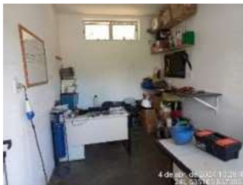
Imagem 9: Depósito de Ferramentas

1.3.6. ALMOXARIFADO : construção com um pavimento com estrutura em concreto, fechamentos em alvenaria revestida interna e externamente, com pintura sobre reboco. Teto com telhado de fibrocimento. Porta de madeira. Pisos cimentado liso.