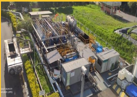
Unidade de recuperação de óleo na Refap

O dia 15 de outubro nos propõe a pensar: Qual o recipiente mais adequado para beber água? Como separar e descartar resíduos de forma adequada? Como tornar nossos processos cada vez mais sustentáveis? O conceito de economia circular considera a participação de matérias-primas e bens ao longo de cadeias complexas de produção e consumo. Em uma empresa como a Petrobras, isso significa atuar de forma sustentável.